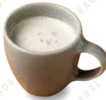
チャイティー HOT/ICED 480