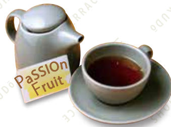
パッションフルーツ 500