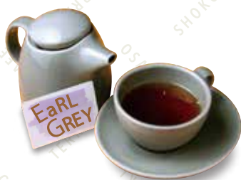
アールグレイ HOT/ICED 500