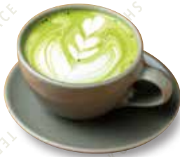
抹茶ラテ HOT/ICED 480