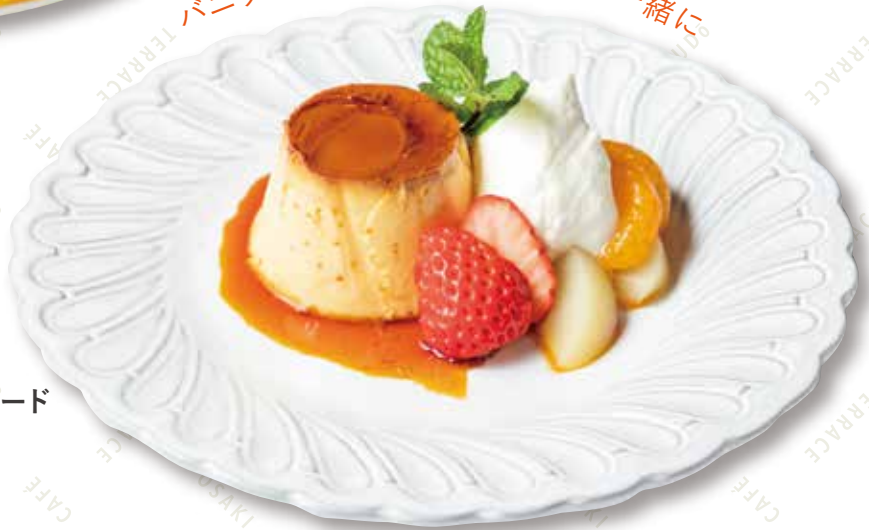
プリンアラモード 680