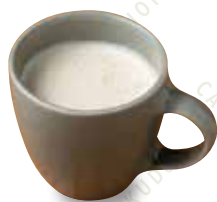
ロイヤルミルクティー HOT/ICED 480