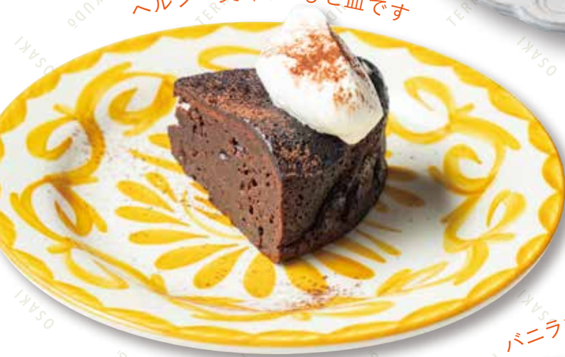
グルテンフリー ガトーショコラ 600