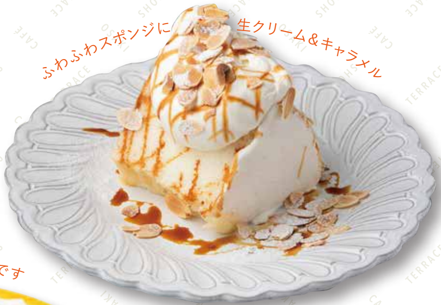
エンゼルフードケーキ バニラ キャラメル 500