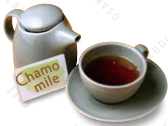
カモミールブレンド 500