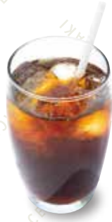
本日の水出しコーヒー TODAY'S COLD BREW COFFEE 480