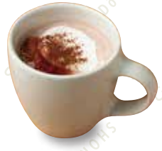
ココア HOT/ICED 580