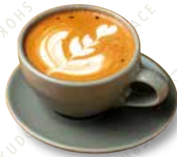
ほうじ茶ラテ HOT/ICED 480